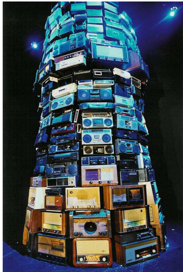
Fig. 2. Babel (2001) Cildo Meireles 2001. Instalação com centenas de rádios sintonizados em estações diferentes.