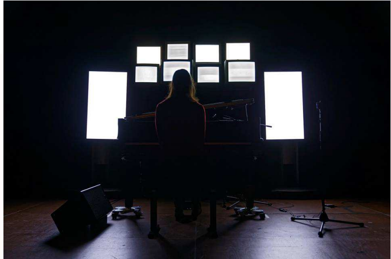
Fig. 4. Simulacrum Piano (2016) . Piano, computadores em rede e monitores de vídeo.