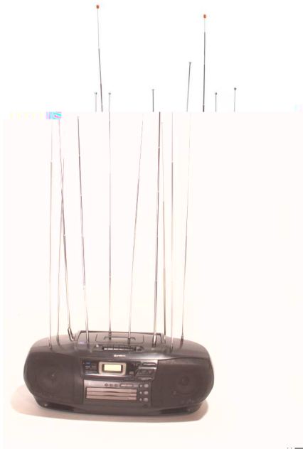
Fig. 3. Adeus 2010 Vivian Caccuri. Sound system, microprocedador, receptores FM e antenas.